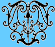
MUSEO NACIONAL DE ARTES DECORATIVAS